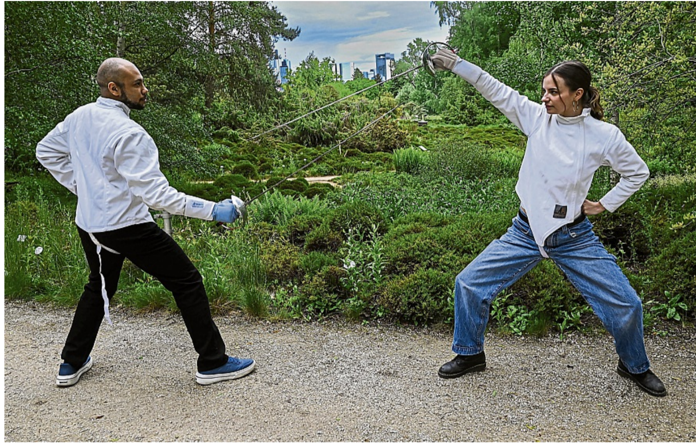
Für Hamlet muss auch das Fechten geübt werden.

Escobios Inszenierung, für die die Vorlage aus zeitlichen